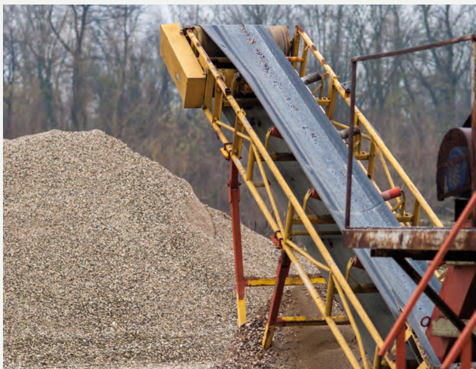
Cinta transportadora de materiales a granel